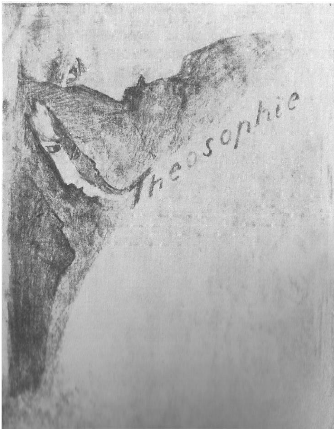
ציור בעיפרון מאת רודולף שטיינר עבור מהדורת 1924 של ספר זה